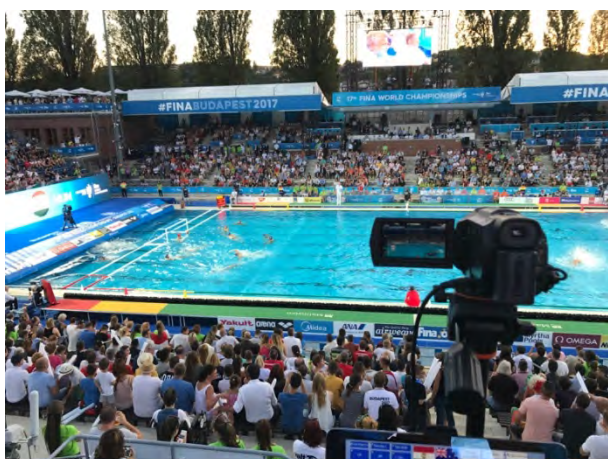
Image 1 Championnat du Monde 2017 Budapest - Hongrie