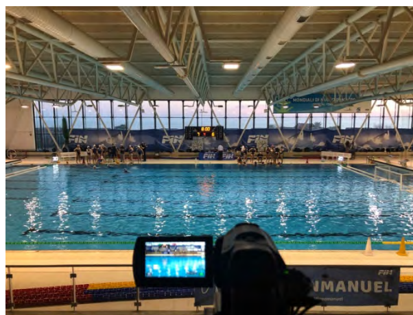
Image 2 Centre Entraînement Ostia - Italie